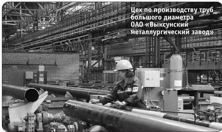
Цех по производству труб большого диаметра ОАО «Выксунский металлургический завод»

Важно и то, что разработчики документа искали как адептов идей, так и оппонентов. Результат — объективность и трезвый расчет, наличие четкого прозрачного плана, основанного на принципе «главного звена». Понимание базовой позиции инвестиционного плана у райо-