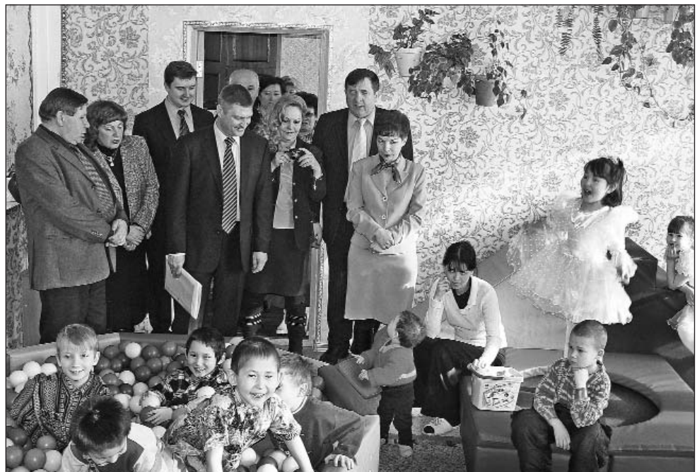
... а также в территориальном центре социальной помощи населению города Бодайбо