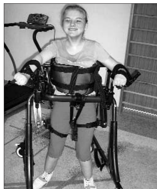
Специальным оборудованием для детей, больных ДЦП, был обеспечен реабилитационный центр «Добродей» в городе Шахты

детей, больных ДЦП. Детям-инвалидам, не способным самостоятельно передвигаться, переданы инвалидные сидения, ортопедические тренажеры для ходьбы, специальные дезинфицирующие средства.