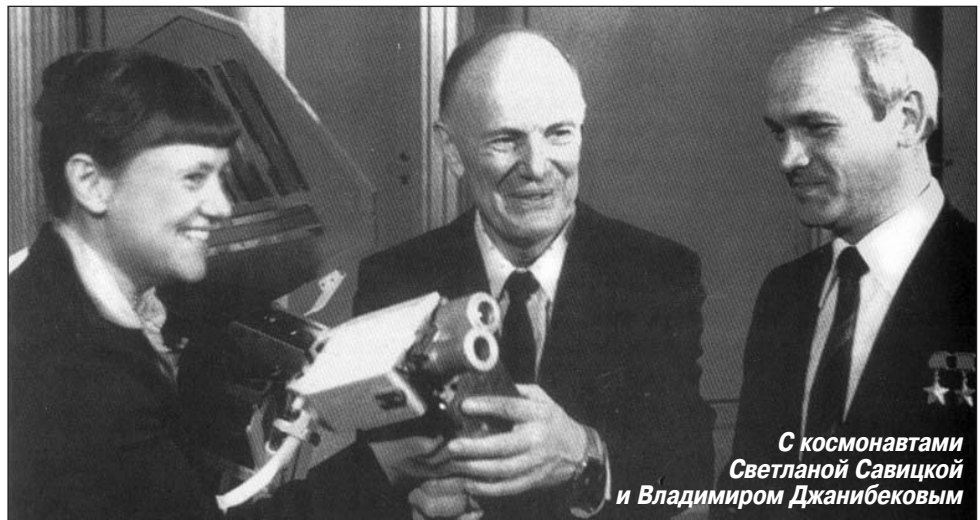
С космонавтами Светланой Савицкой и Владимиром Джанибековым

ональных лабораторий, крупных университетов, где как на Западе и в Америке развивалась бы наука. У нас же еще в период Сталина появились исследовательские институты в рамках Академии наук, и они стремительно развивались. Угробить нашу Академию только ради того, чтобы копировать Запад, — это было бы преступлением! Уничтожить легко, здания институтов (а в Москве их много на Ленинском проспекте) приватизировать, и на этом можно поставить на науку жирный крест.