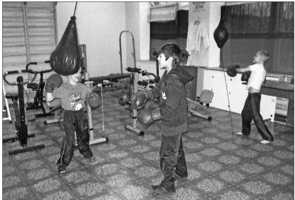
Детский дом № 12 им. Г. Алексеева в городе Инта (Республика Коми) Фонд обеспечил спортивным инвентарем