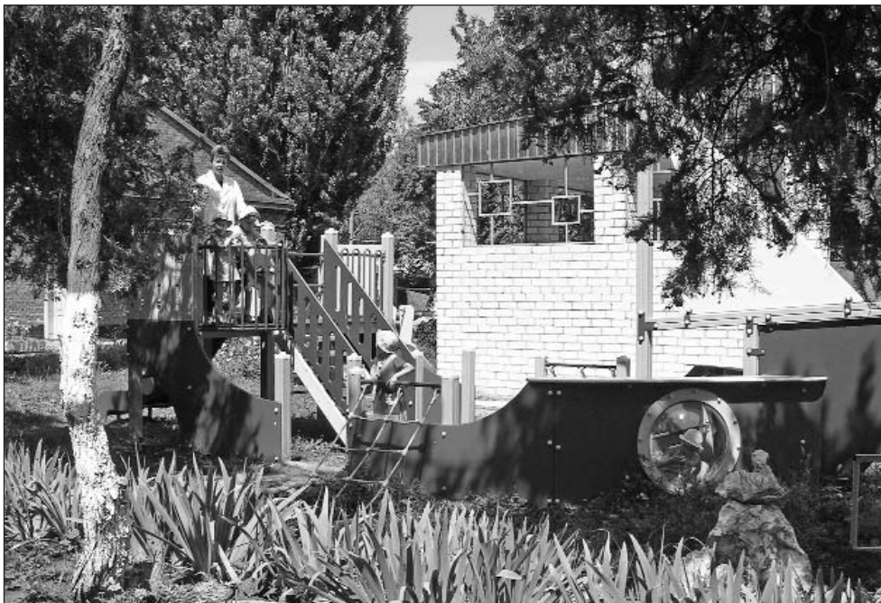
На средства Фонда была оборудована детская площадка в детдоме города Армавир