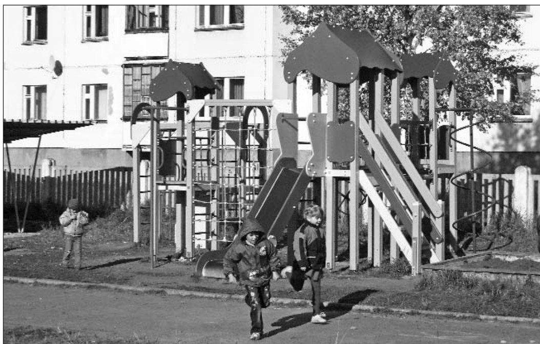
С помощью Фонда в Северодвинском социально-реабилитационном центре «Солнышко» оборудована детская площадка