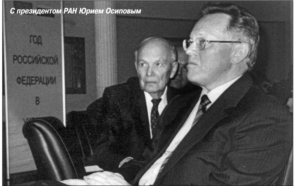
С президентом РАН Юрием Осиповым

— Эти «шароварщики» изгалялись надо мной как могли! И особенно упрекали за то, что мы используем русский язык. Пришлось выступать на сессии Верховного Совета: я сказал, что наука интернациональна. И как же на меня обрушились, мол, как я могу так говорить — ведь наука национальна! Да, я им отвечаю, есть языкознание, литература — и это национальная наука. А потом спрашиваю их об ес-