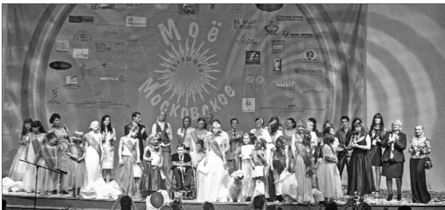
Одно из самых ярких событий прошлого года – фестиваль для детей-сирот и инвалидов «Мое московское солнышко», организатором которого был Благотворительный фонд «Центр помощи беспризорным детям» ТПП РФ