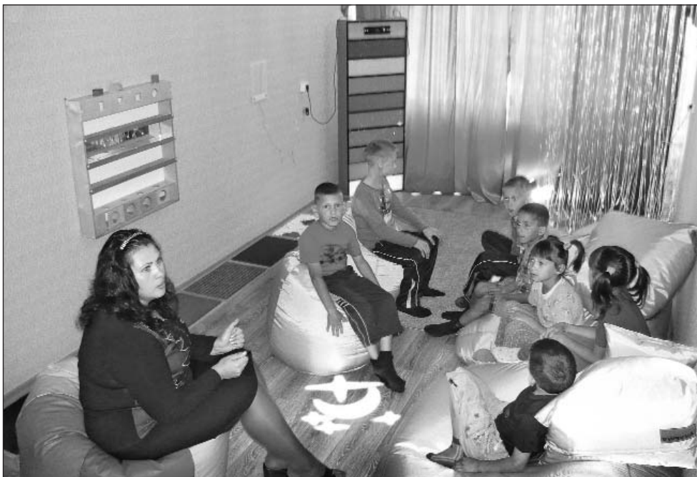
С помощью Фонда были оборудованы сенсорные комнаты в детском доме города Алдан...

Одно из основных направлений работы Фонда – деятельность, направленная на укрепление здоровья воспитанников детских интернатных учреждений. В прошлом году 13 учреждений были оборудованы спортивно-игровыми площадками и обеспечены спортивным инвентарем. Необходимое оборудование получили 10 учреждений Красноярского края, Курганской, Мурманской, Ростовской, Тульской областей и Москвы, где воспитываются и проходят лечение дети, страдающие тяжелыми заболеваниями. Были приобретены реабилитационные костюмы для