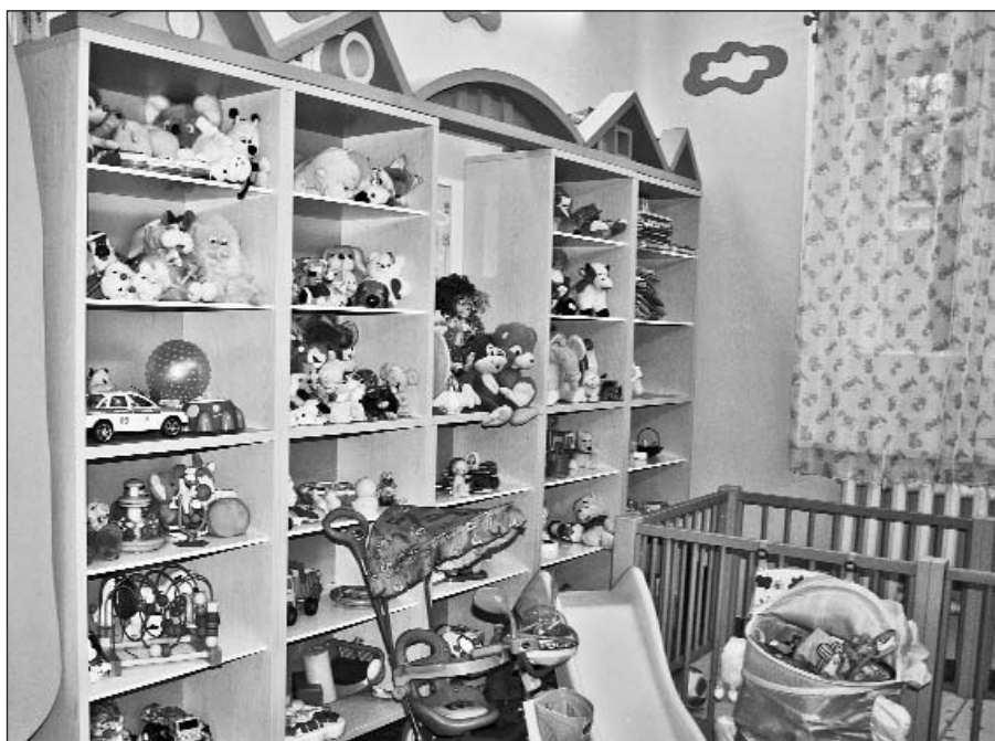
После благотворительной выставки игрушек «экспонаты» переданы в Морозовскую детскую городскую клиническую больницу Москвы